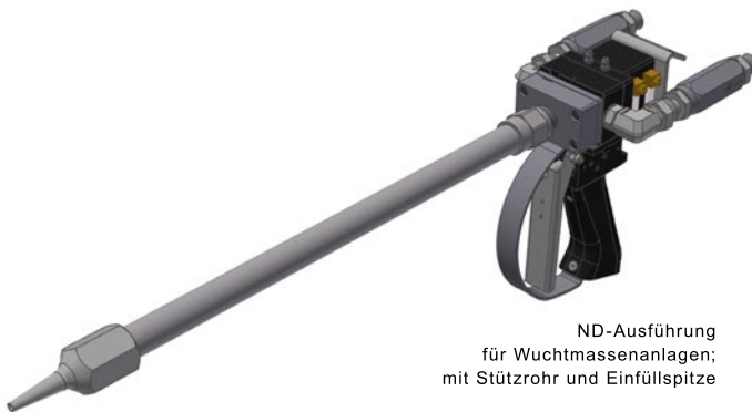
ND-Ausführung für Wuchtmassenanlagen; mit Stützrohr und Einfüllspitze