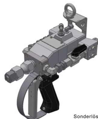
Sonderlösung (ND); Spülen mit A-Komponente