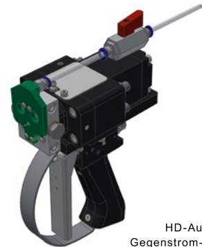
HD-Ausführung Gegenstrom-Injektion mit Zerstäuber-aufsatz